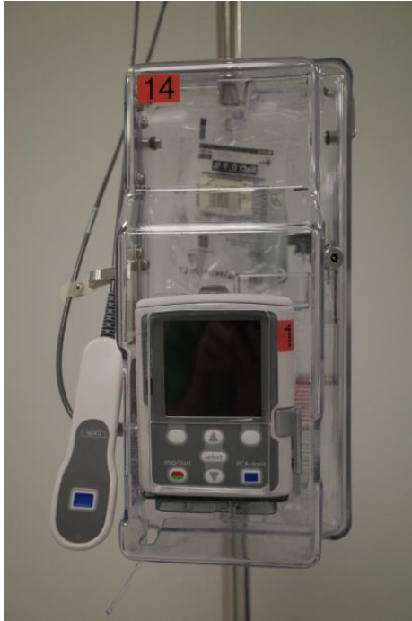
PCA-pomp met bedieningsknop

Een PCA-pomp, ook wel “pijnpomp” genoemd, is een computergestuurd toestel. Je kan zelf via een bedieningsknop een bepaalde hoeveelheid medicatie toedienen op het moment dat je het nodig heeft. Jij voelt de pijn en jij kan het best beoordelen wanneer je pijnstilling nodig hebt.